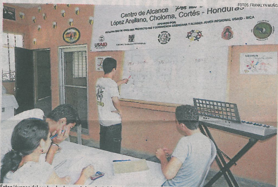
Estos jóvenes del centro de alcance de la colonia López Arellano son estudiantes que buscan apoyo en el área de matemáticas.

De los 800 jóvenes que acuden a cada centro, un porcentaje son estudiantes de colegios, a los cuales se les busca alejar de las maras y otro porcentaje son los que ya no siguen integrando es-