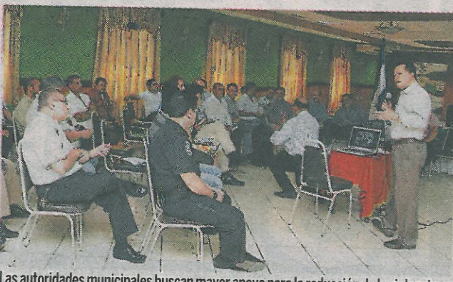
Las autoridades municipales buscan mayor apoyo para la reducción de la violencia.